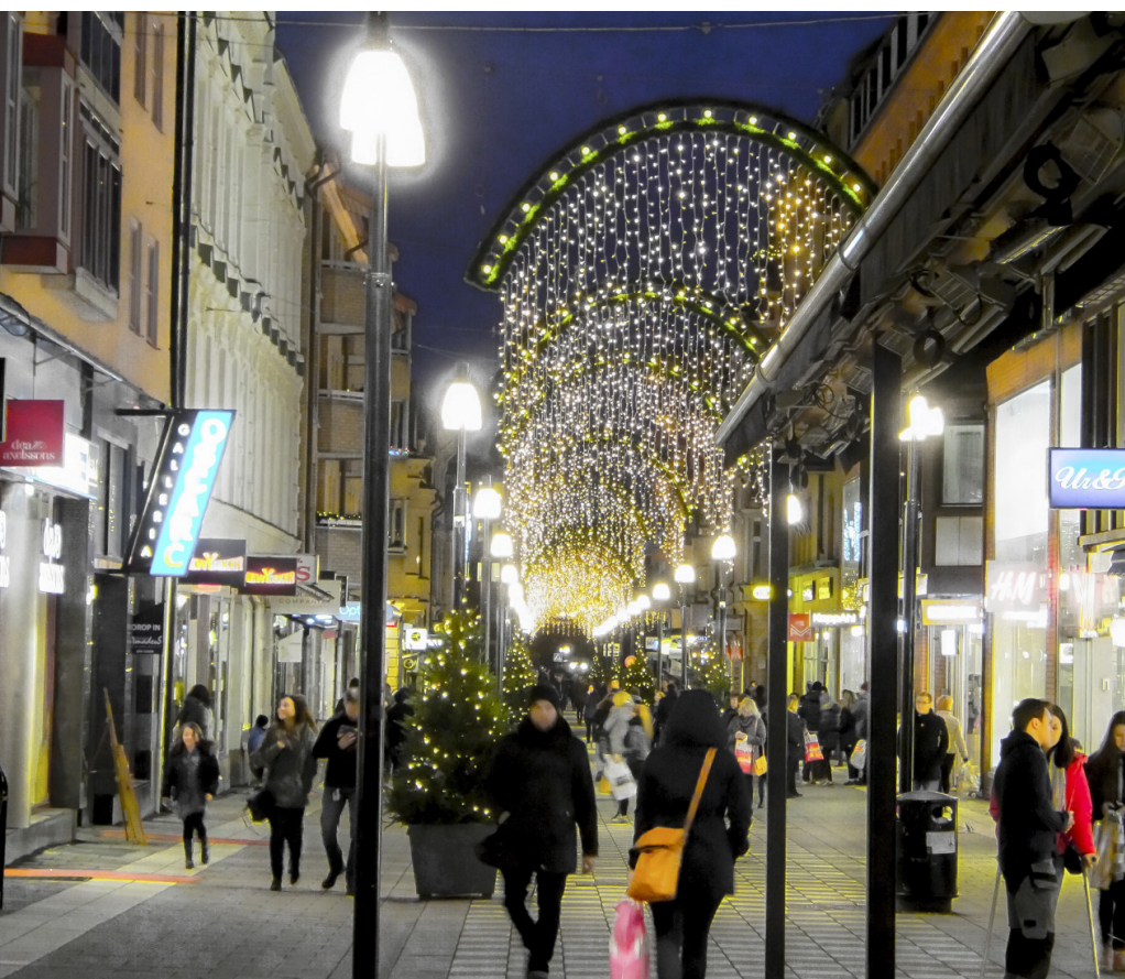
Gemensam julskyltning finansierad av fastighetsägarna

och kommer överens med förekommande BID att dessa bidrar med utstakade insatser utöver denna grundnivå.