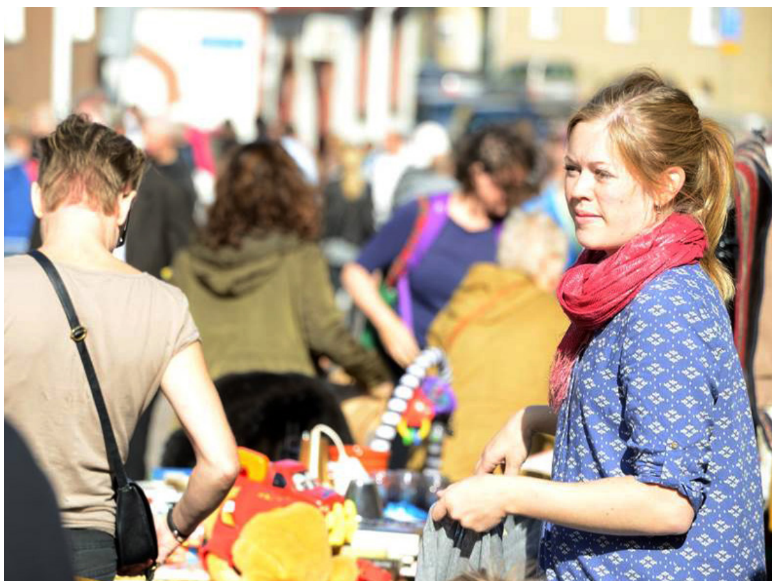
Loppis i Gamlestaden, Göteborg

av området. Ökad attraktion, konkurrenskraft och i förlängningen höjda fastighetsvärden är de vanliga drivkrafterna. Att områden och utmaningar ser olika ut på olika platser gör att samverkansmodellerna också kan skilja sig åt i sin utformning.